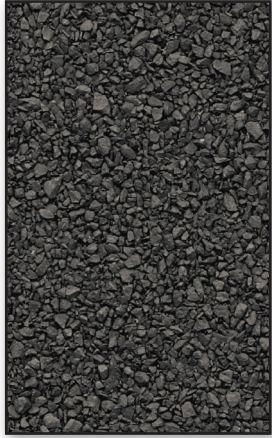
Charcoal Grey/ Gris charbon