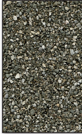
Frostone Grey/ Gris givré